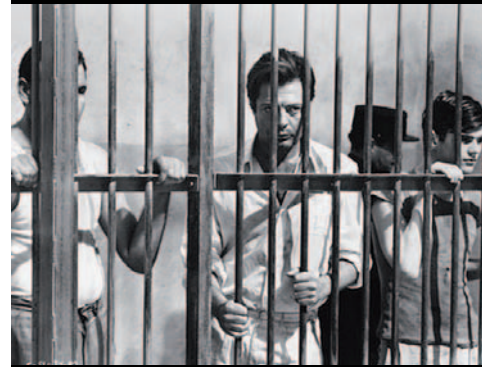
DER FREMDE mit Marcello Mastroianni, Anna Karina, Bernard Blier, George Géret, Alfred Adam